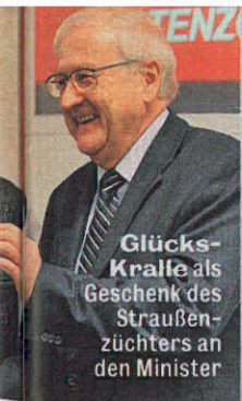
Glücks-Kralle als Geschenk des Straußenzüchters an den Minister